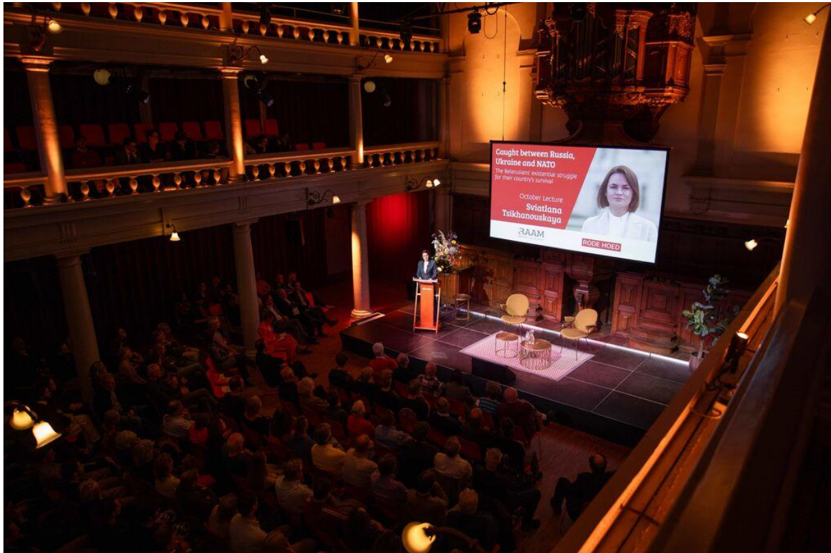
Een volle Rode Hoed luistert naar de Oktoberlezing door Sviatlana Tsichanouskaja