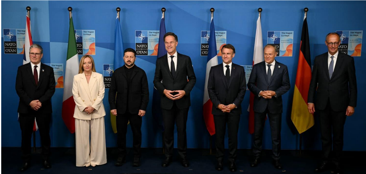
2025 was onder meer het jaar van de NAVO-top in Den Haag, met hier op de foto de belangrijkste Europese leiders samen met de Oekraïense president Zelensky.